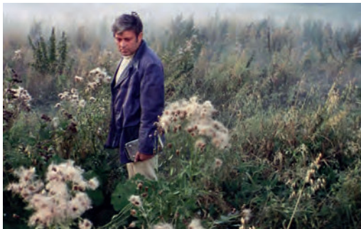
Solaris (Andréi Tarkovski, Unión Soviética, 1972)

El festín de Babette (Babettes gæstebud) Gabriel Axel, Dinamarca, 1987, 102'