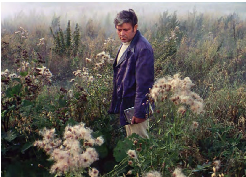
Solaris (Andrei Tarkovski, Unión Soviética, 1972)