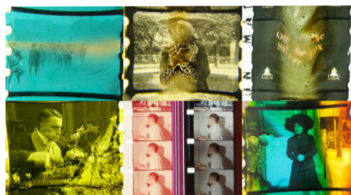
Cine, registro vivo de nuestra memoria (Inés Toharia, España-Canadá, 2023)

Las tierras del cielo Pablo García Canga, España, 2023, 83'