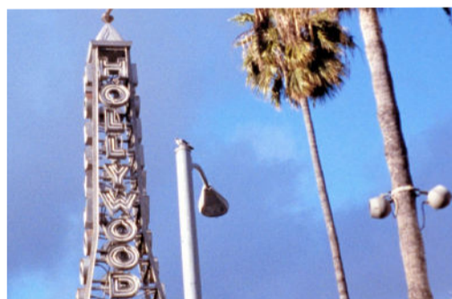
Los Angeles Plays Itself (Thom Andersen, EEUU, 2003)

Los ensayos cinematográficos de Thom Andersen, uno de los cineastas estadounidenses más brillantes de las últimas décadas, reflexionan sobre la naturaleza del medio cinematográfico, desvelando la amnesia y los efectos ideológicos que tienen las producciones de Hollywood en la memoria popular, a menudo con puntos de vista próximos a la filosofía. Su obra más celebrada, Los Angeles Plays Itself , es un fresco monumental que utiliza imágenes de superproducciones de Hollywood y películas de vanguardia o serie B para demostrar que el cine tiene una influencia profunda en la realidad del mundo que nos rodea.