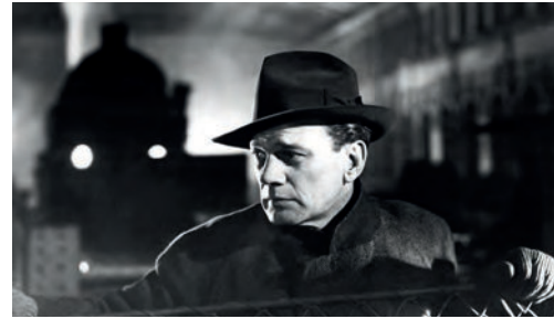
El tercer hombre (Carol Reed, Reino Unido, 1949)