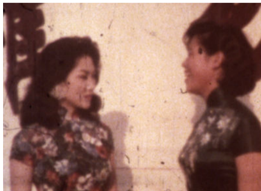
Jelly Fish Sandwich (Luther Price, EEUU, 1994)

El programa de este mes está dedicado a la figura del recientemente desaparecido Luther Price, simpático cineasta estadounidense que desarrolló una carrera profundamente desafiante y subversiva, mezclando el cine, la performance y la música en películas inclasificables y emocionantes. Descubriremos tres de sus piezas fundamentales en Super-8.