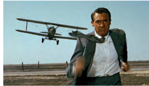
Con la muerte en los talones (Alfred Hitchcock, EEUU, 1959)

Jennie (Portrait of Jennie) William Dieterle, EEUU, 1948, 86'