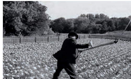
La cinta blanca (Michael Haneke, Alemania-Austria-Francia, 2009)