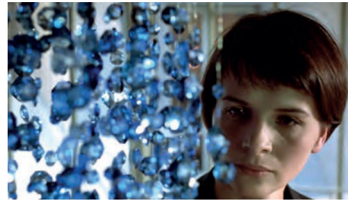
Tres colores: Azul (Krzysztof Kieslowski, Francia-Polonia-Suiza, 1993)

Tres colores: Azul (Trois couleurs : Bleu) Krzysztof Kieslowski, Francia-Polonia-Suiza, 1993, 98'